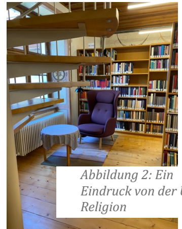
Abbildung 2: Ein Eindruck von der UB Religion

Bis es dafür zu kalt wird gibt es beinahe immer einen Flohmarkt in einem Quartier, und sonst findest du günstige Shopping-Alternativen in SecondHand und Vintage Läden. Highlights des Alltags sind die Brunnen an jeder Ecke mit Trinkwasser und saisonbedingte Angebote, wie die Herbstmäss .