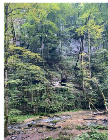
Abbildung 4: Direkt außerhalb von Basel