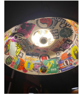
Abbildung 6: Eine Lampe in einer der eher subversiven Bar (Hirscheneck)

Für alle Queers: Basel kann dich mit seinen Bars, Treffpunkten und Szene-Angeboten überraschen. Niedrigschwellig kannst du Gleichgesinnte (z. B. beim wöchentlichen pink.friday-Angebot der Kult.Kinos) kennenlernen und die Nähe zum schweizerischen queeren HotSpot Zürich genießen.