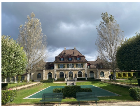
Abbildung 1: Kastell Kaiseraugst (Ort eines Blockseminars im Umland)

in zwei Jahren angeboten. Wenn du allerdings lediglich einen change of scenery suchst und dich auf diese neue Stadt, das neue Land, einlässt, hat die Fakultät ein großes Potential, dich zu bereichern.