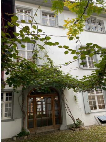
Abbildung 3: Der zweite Innenhof der Fakultät

Kleine Side-Notes : Die Öffnungszeiten der Bibliotheken scheinen zunächst begrenzt, jedoch kannst du unkompliziert einen Antrag auf verlängerte Öffnungszeiten stellen und dann (teils als letzte Person im gesamten Gebäude) abends bis 22h das 700 Jahre alte Gebäude mit seinem gemütlichen Charme, mehreren Brunnen und Innenhöfen erleben.