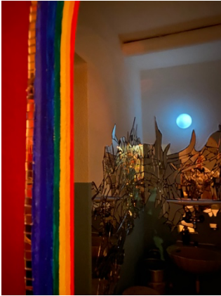
Abbildung 5: Eine Bar in Kleinbasel

Die Nähe zu Deutschland und Frankreich, sowie Geschäfte wie die Äss-Bar und die Küche der Fachgruppe, erleichtern das Portemonnaie. Es gibt zahlreiche Bars und Pubs, immer wieder Partys und Raves, jedoch weniger Clubs.